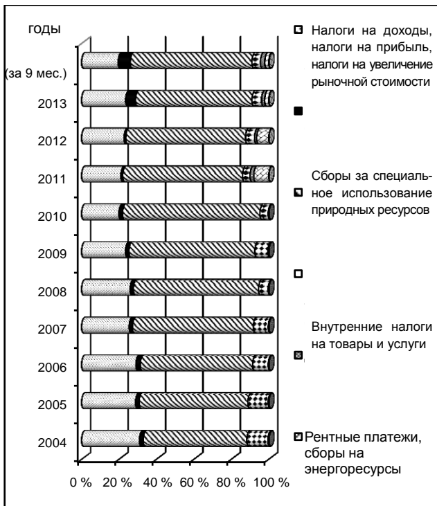
Рис. 1. Структура доходов в Государственный бюджет Украины за период с 2004 по 2014 год [The structure of the revenues to the State Budget of Ukraine for the period from 2004 to 2014]

Структура общих поступлений, которая представлена на рис. 1, свидетельствует о ее нестабильности. Так, начиная с 2004 года, львиную долю доходов государственного бюджета формируют налоги на товары и услуги, то есть внутренние налоги, и такая тенденция сохраняется на протяжении всего периода анализа. Наибольший удельный вес такая группа налогов имела в 2010 году. Второе место заняли налоги на прибыль и доходы. Но с 2005 года начинается постепенное снижение этой группы налогов