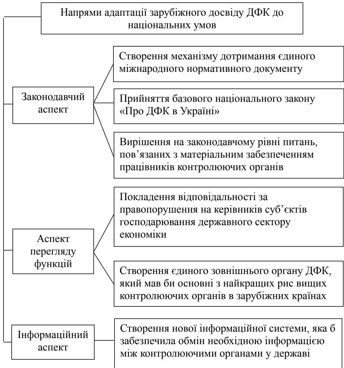
Рис. 1.2. Напрями адаптації зарубіжного досвіду ДФК до національних умов

Висновок. Наукова новизна даного дослідження полягає в розробці і обґрунтуванні напрямів адаптації зарубіжного досвіду ДФК до національних умов. При цьому, як напрямок подальших досліджень, варто зазначити, необхідність дослідження людського фактору в забезпеченні ефективності ДФК.