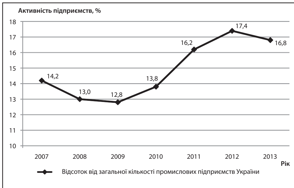
Рис. 2. Динаміка інноваційної активності промислових підприємств (у % до загальної кількості промислових підприємств в Україні)

кості промислових підприємств по Україні проти 1758 підприємств (17,4 %) у 2012 р., що свідчить про зниження їхньої інноваційної активності. Динаміку наведено на рис. 2 [7].