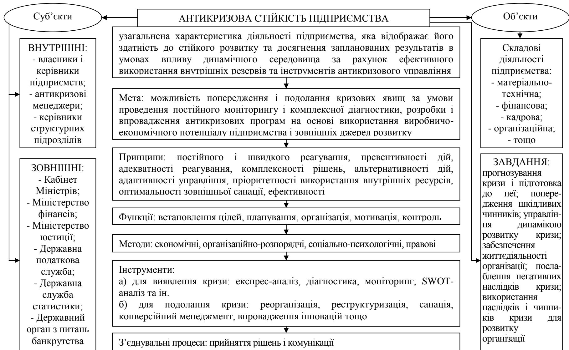
Рис. 2. Система антикризової стійкості промислового підприємства