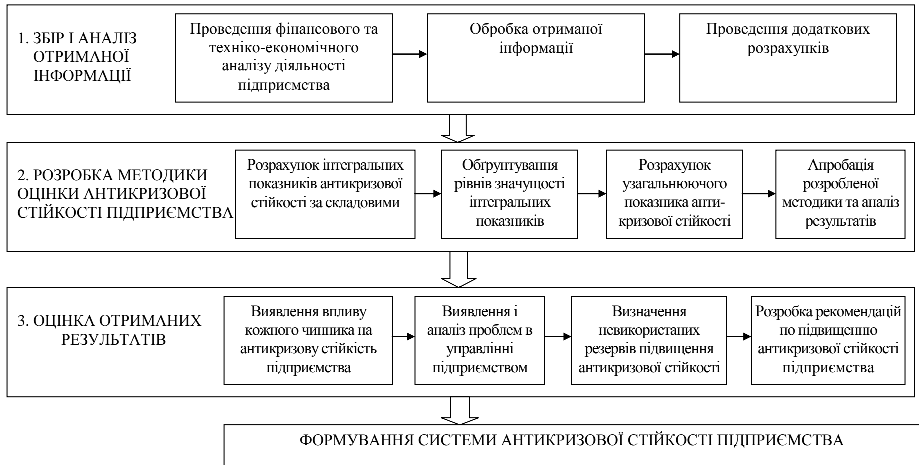
Рисунок 1 – Запропонований підхід до оцінки антикризової стійкості підприємства