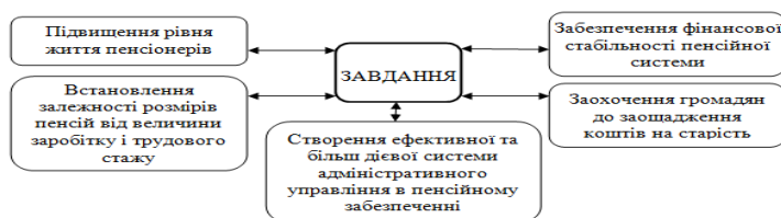
Рис. 1. Основні завдання пенсійної реформи в Україні

Основні завдання пенсійної реформи в Україні наведені на рис. 1. [1].