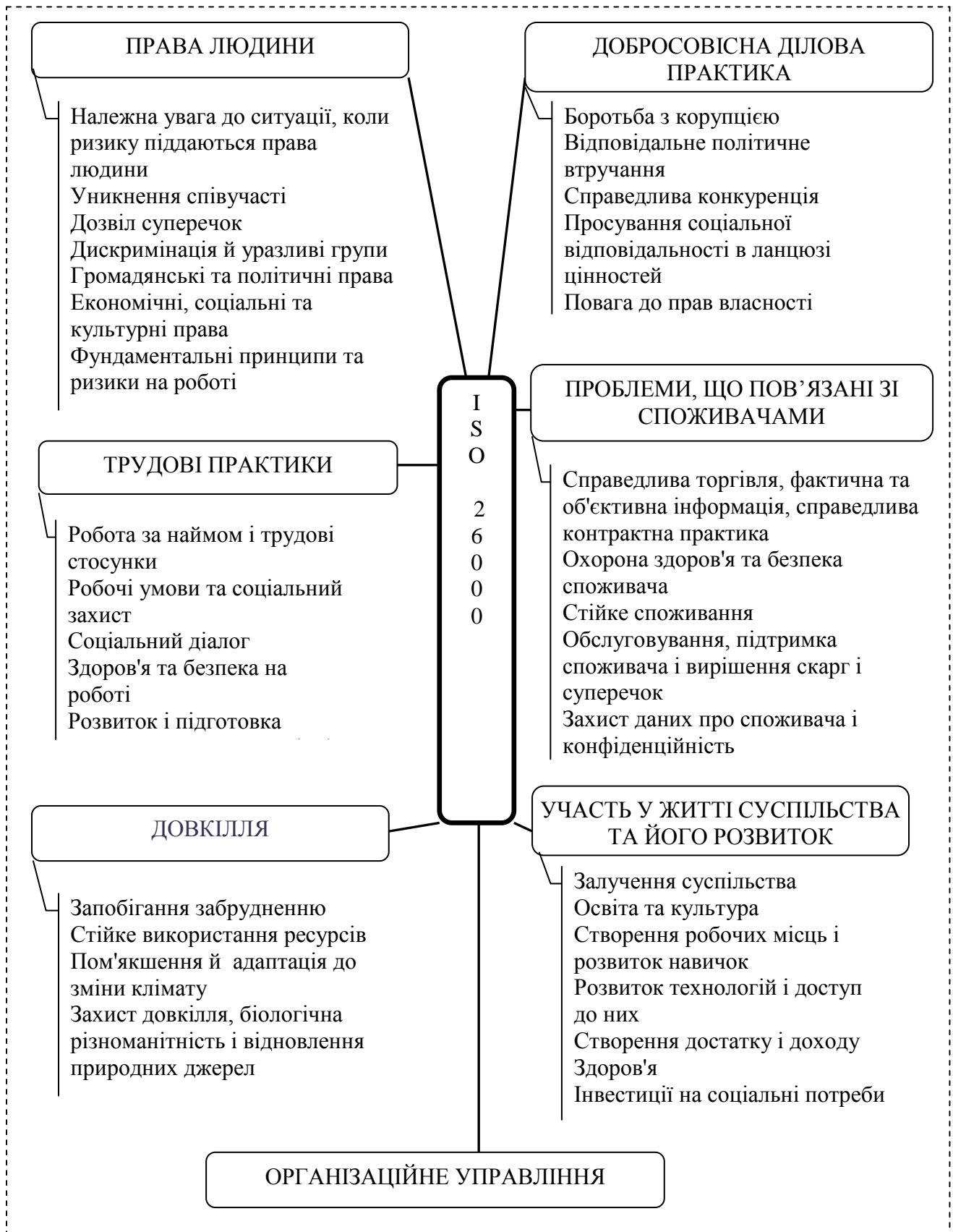
Рис. 1. Основні об'єкти та проблеми соціальної відповідальності відповідно до стандарту ISO 26000