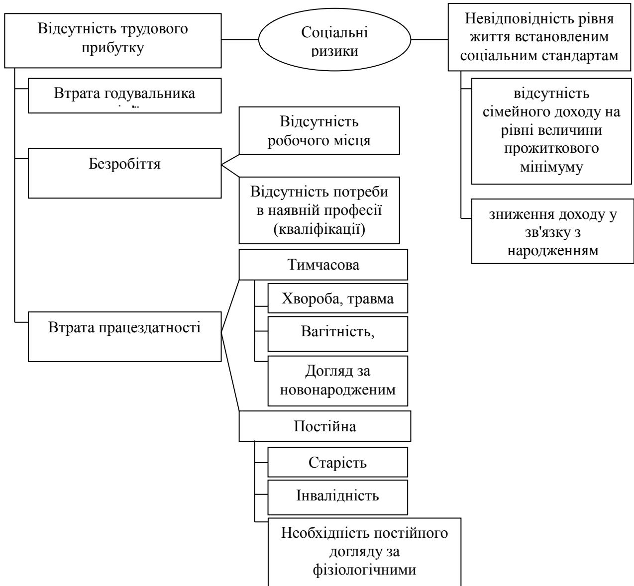
Рис. 1. Класифікація видів соціального ризику

Ризиками можна управляти, тобто використовувати різноманітні заходи, які б давали змогу певним чином прогнозувати виникнення ризикової ситуації і вжити заходів для зниження рівня ризику.