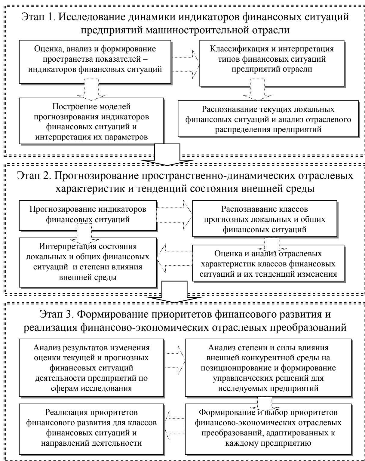
Рис. 1. Этапы механизма управления финансовыми ситуациями промышленных предприятий

предприятий машиностроительной отрасли. Системность и комплексность предлагаемого механизма лежит во взаимосвязи и последовательности с основными функциями и задачами управления финансовыми ситуациями.