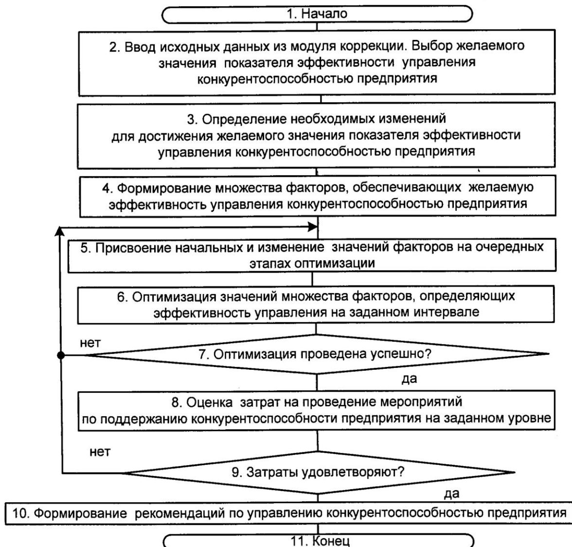
Рис. 2. Алгоритм управления КСП

Этот критерий лежит в основе процедур алгоритма управления КСП. Укрупненная схема алгоритма представлена на рис. 2.