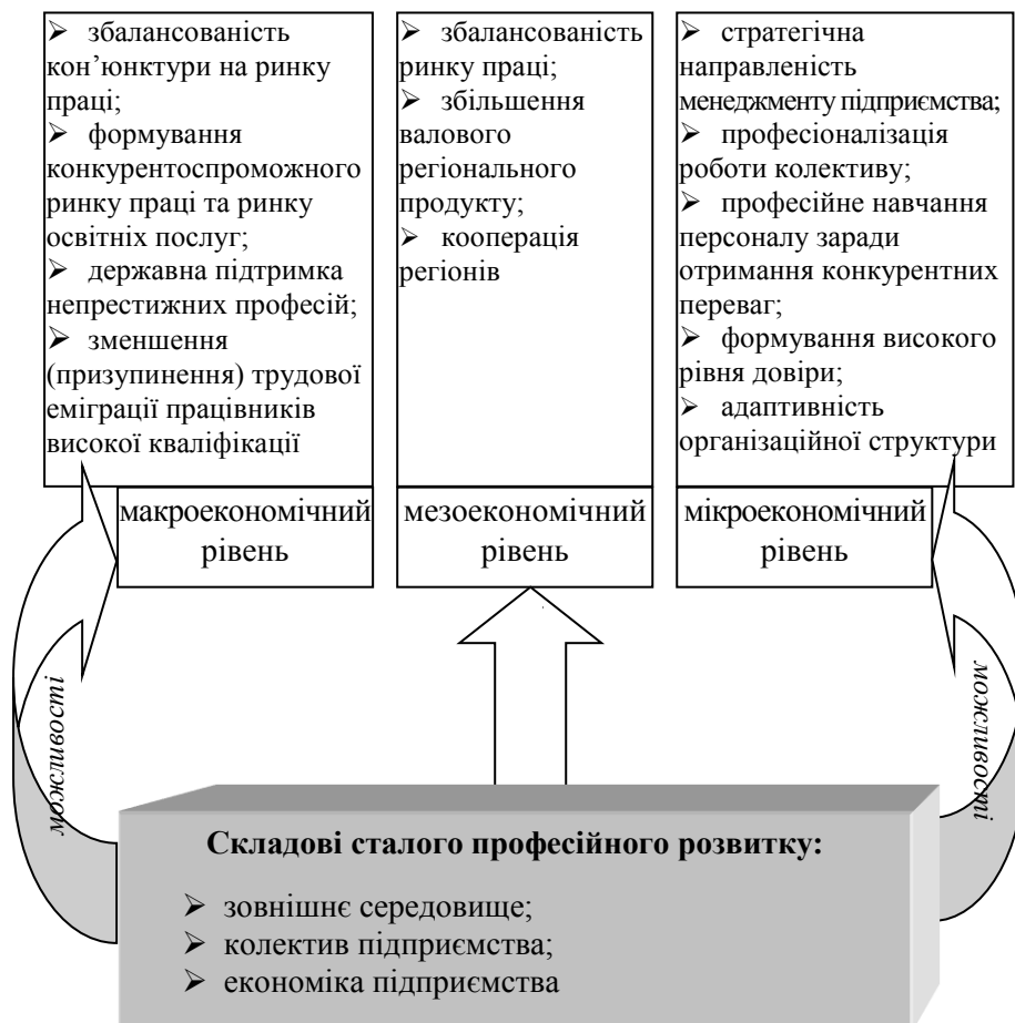
Рис. 1. Можливості, що надає сталий професійний розвиток працівників для макро-, мезо- та мікроекономічного рівня

окремих господарюючих суб'єктів, що знаходяться на певній території, та акумулюються регіональним представництвом. Останні формують мезоекономічний рівень – рівень регіону як територіальної одиниці, в межах якого активну позицію займає соціально-економічна політика області, її інвестиційна привабливість, віддаленість від державних кордонів, транскордонне співробітництво, запровадження міжнародних програм, серед яких, наприклад, відокремлюються ПРООН, TACIS, МВФ, МБРР тощо. В межах мікроекономічного рівня проводиться професійне навчання працівників. Розгляд проблематики можливостей доцільний тільки у тісному взаємозв'язку явищ та процесів крізь призму рівневості (рис. 1).