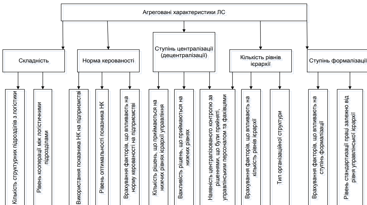
Рис. 2. Агреговані характеристики ЛС та чинники, що їх визначають