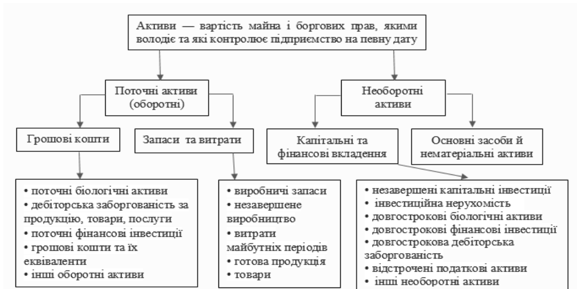
Рис. 1. Склад активів підприємства [2, с. 187; 4; 8, с. 92-95]

Оборотні кошти підприємства відрізняються від основних активів тим, що підприємство володіє цими засобами впродовж періоду, що не перевищує один рік. Протягом деякого часу (менше одного року) ці засоби трансформуються в гроші, потім оборотні кошти поповнюються, забезпечуючи тим самим безперервний процес поточної діяльності підприємства. Завдання управління активами підприємства можна поділити на завдання управління оборотними і необоротними активами. При управлінні оборотними активами необхідно комплексно оцінювати їх позитивні та негативні сторони, порівняно з необоротними активами. Основне завдання управління необоротними активами полягає у забезпеченні своєчасного оновлення основних виробничих фондів та високої ефективності їх використання. Можливості оперативного управління необоротними активами незначні. І, навпаки, політика управління оборотними активами відзначається значною маневреністю, можливістю активного впливу на їх розмір, склад, структуру, оборотність, ліквідність та прибутковість. До основних завдань управління оборотними активами належать: