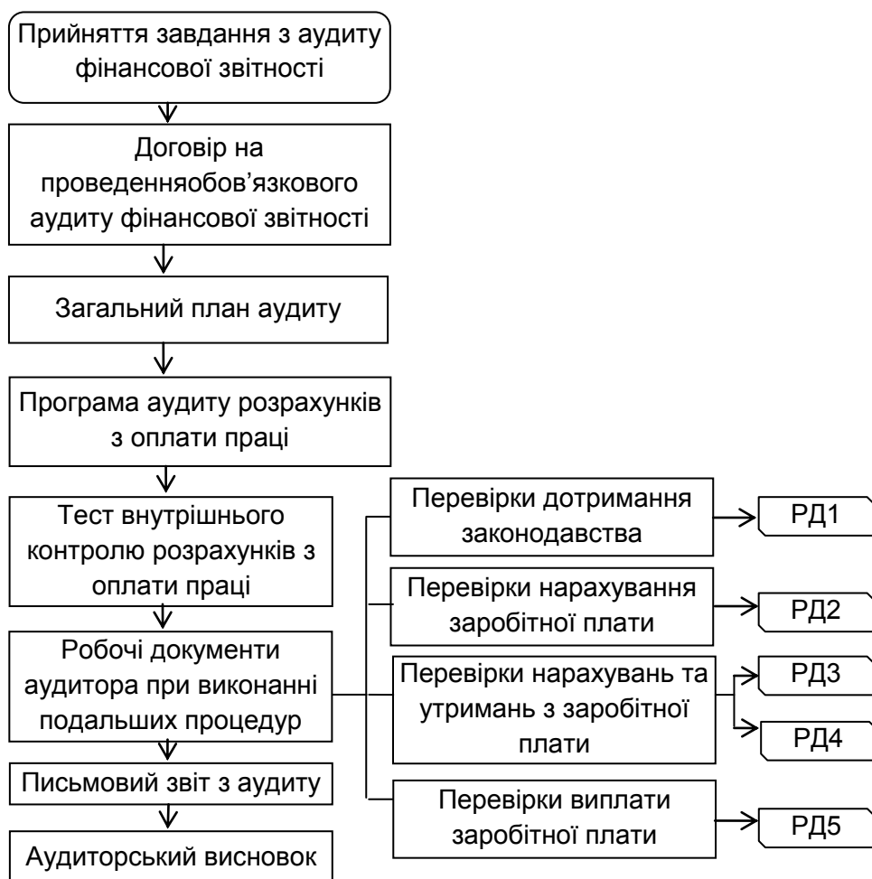
Рис. 3. Послідовність документування процедур аудиту розрахунків з оплати праці (систематизовано та адаптовано автором [1, с. 37])

проведення перевірки та зменшити кількість помилок при документуванні процедур аудиту розрахунків з оплати праці. На рис. 3 автором виокремлено блок документування аудиту розрахунків з оплати праці в складі загального аудиту фінансової звітності.