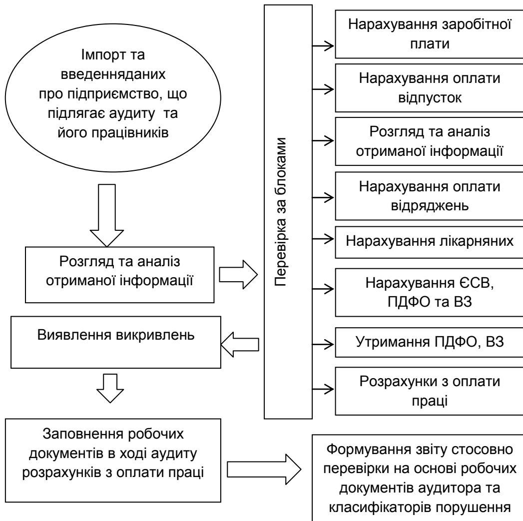
Рис. 2. Схема роботи підходу з використанням програмного забезпечення щодо проведення та документування аудиту розрахунків з оплати праці (розроблено автором)

рахунок автоматизації операцій, на які при перевірці вручну витрачалося багато часу та виникали помилки внаслідок людського фактора[3, с. 136].