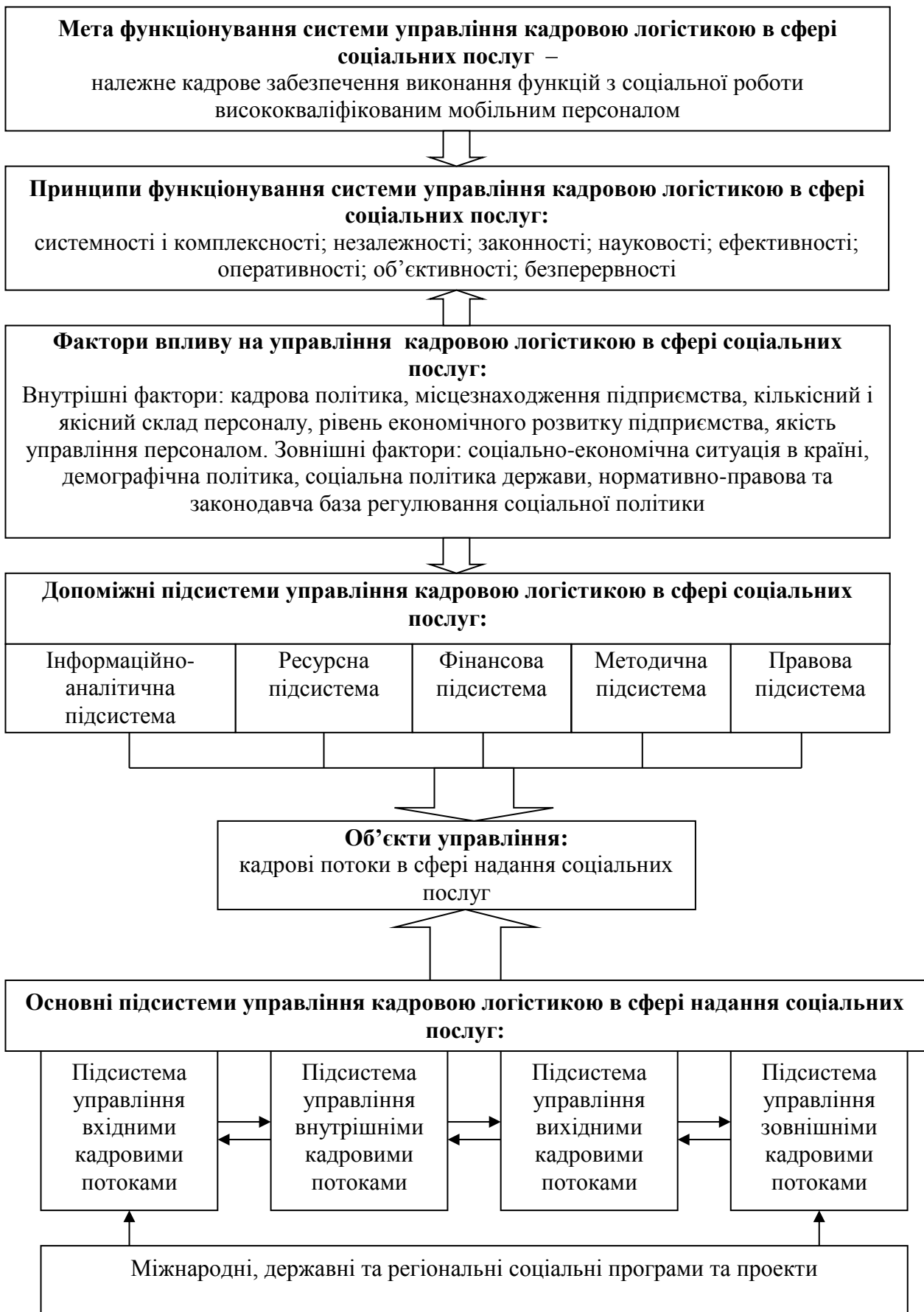
Рис. 3. Структура системи управління кадровою логістикою в сфері надання соціальних послуг