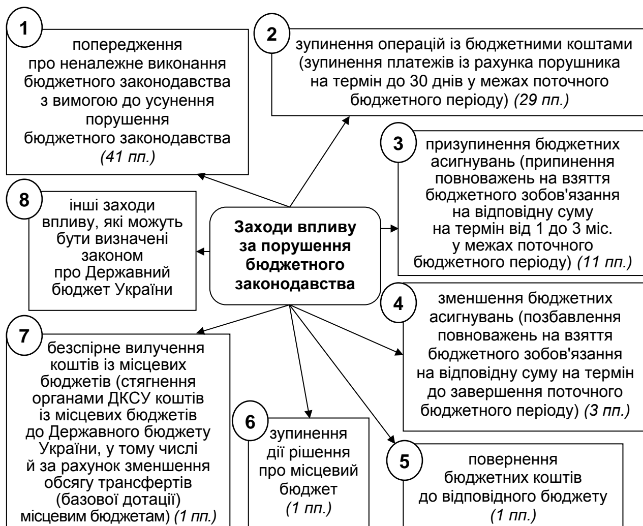
Рис. 2. Заходи впливу за порушення бюджетного законодавства

Заходи впливу за порушення бюджетного законодавства встановлено ст. 117 Бюджетного кодексу України та наведено на рис. 2.