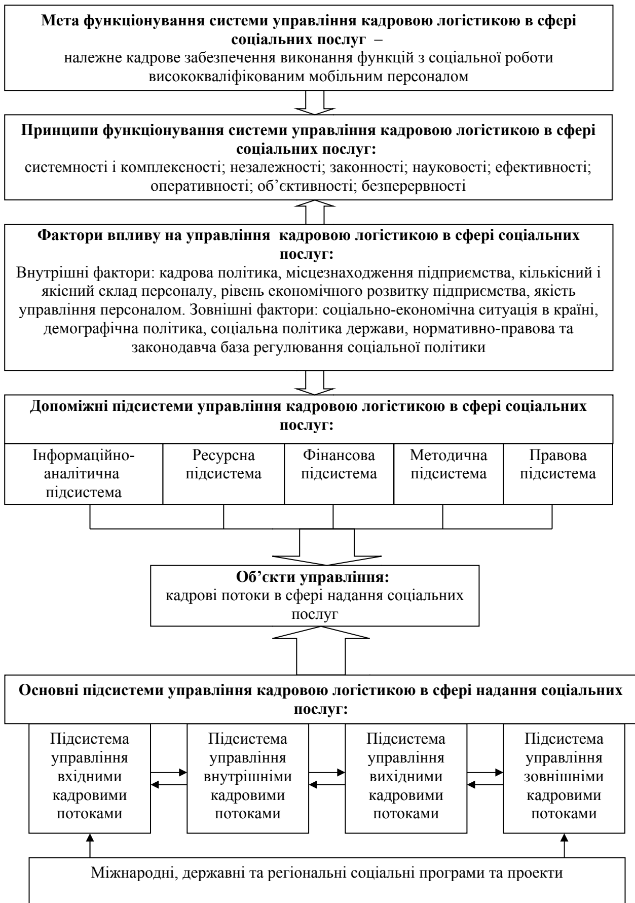
Рис. 3. Структура системи управління кадровою логістикою в сфері надання соціальних послуг