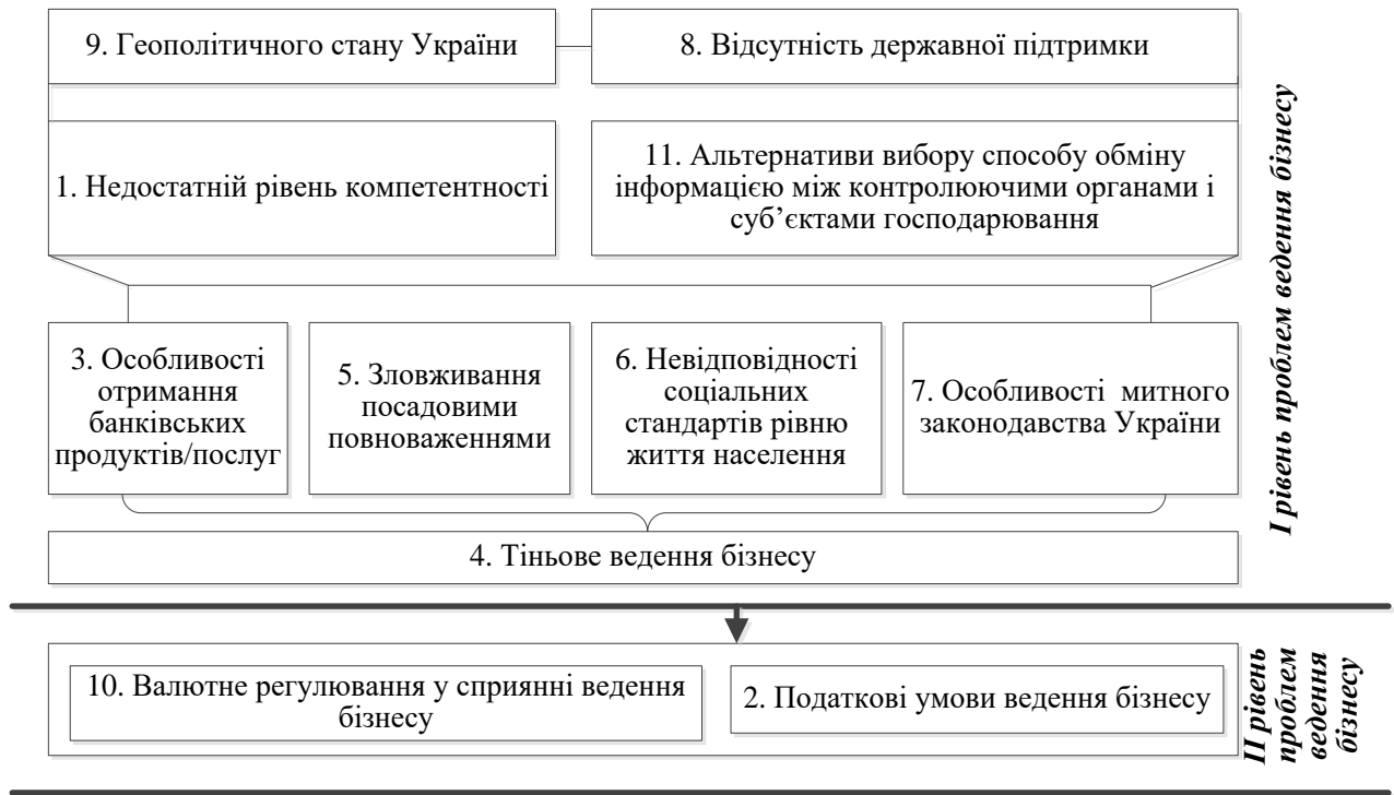
Рис. 2. Ієрархічно структурований граф проблем ведення бізнесу в Україні

банківських продуктів/послуг) проблем та наявного тіньового сектору ведення бізнесу в неефективне управління та складні податково-валютні умови ведення бізнесу в Україні.