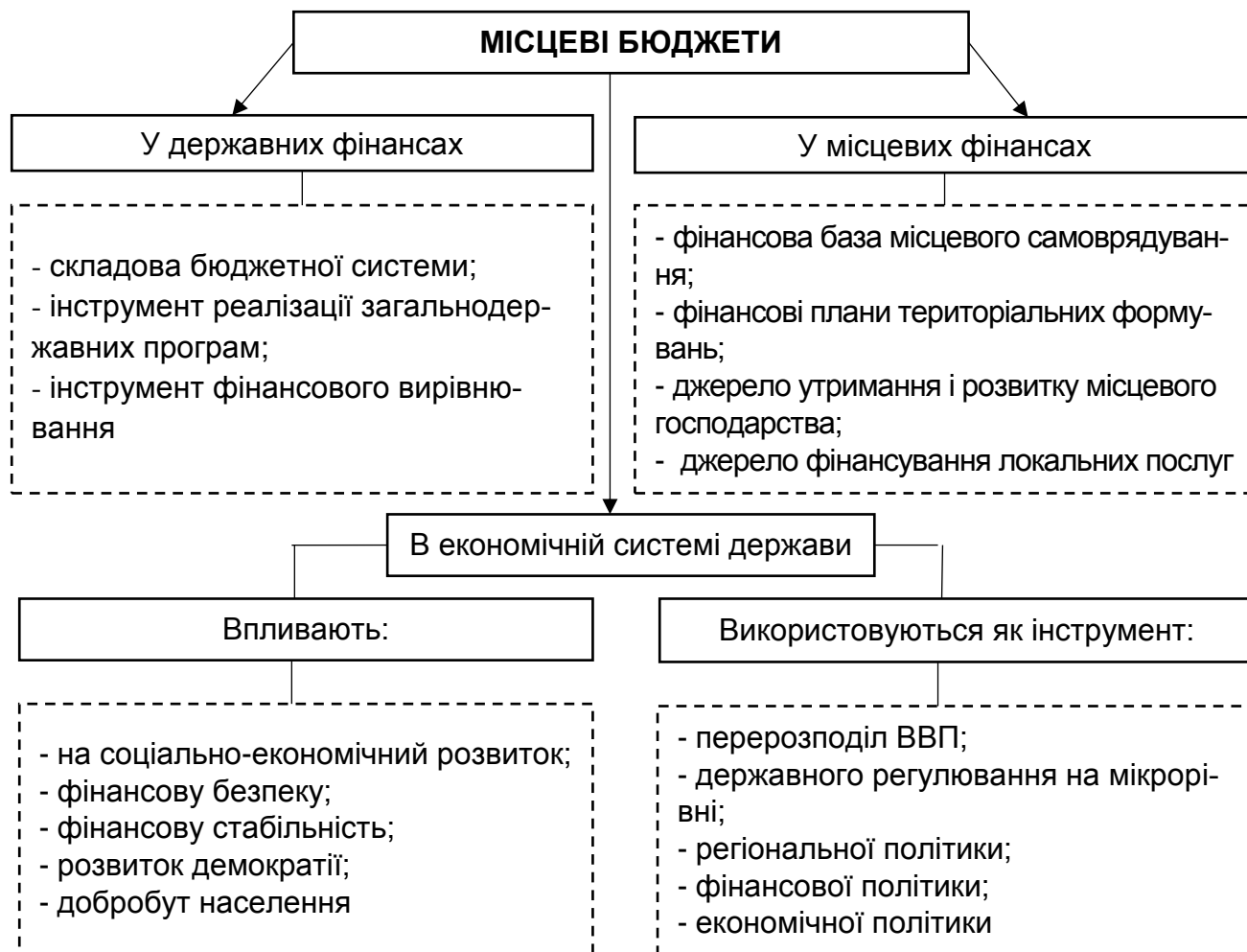
Рис. 2. Суспільна роль місцевих бюджетів

Проаналізувавши та визначивши поняття «місцеві бюджети», можна зауважити, що місцеві бюджети займають особливе місце не лише в бюджетній системі держави, але й одне з центральних місць в економічній та фінансовій системі держави, а також відіграють важливу суспільну роль (рис. 2).