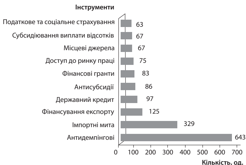
Рис. 1. Найбільш поширені інструменти, які застосовують у торговельних війнах між країнами, од.