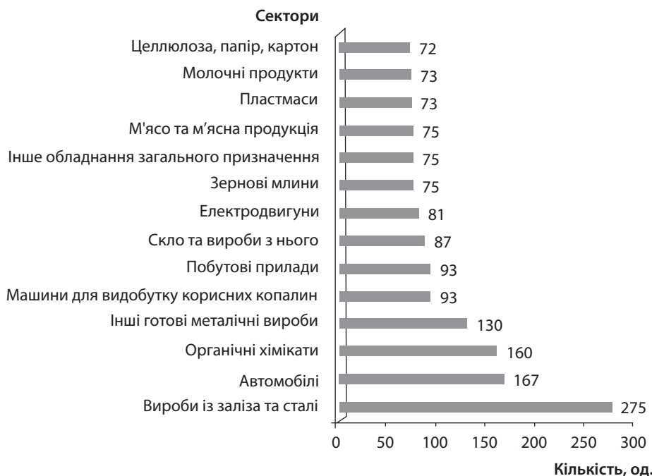
Рис. 2. Найбільш популярні сектори, в яких створено торговельні бар'єри в міжнародній торгівлі за 2009–2017 рр., од. Джерело: складено за [12].