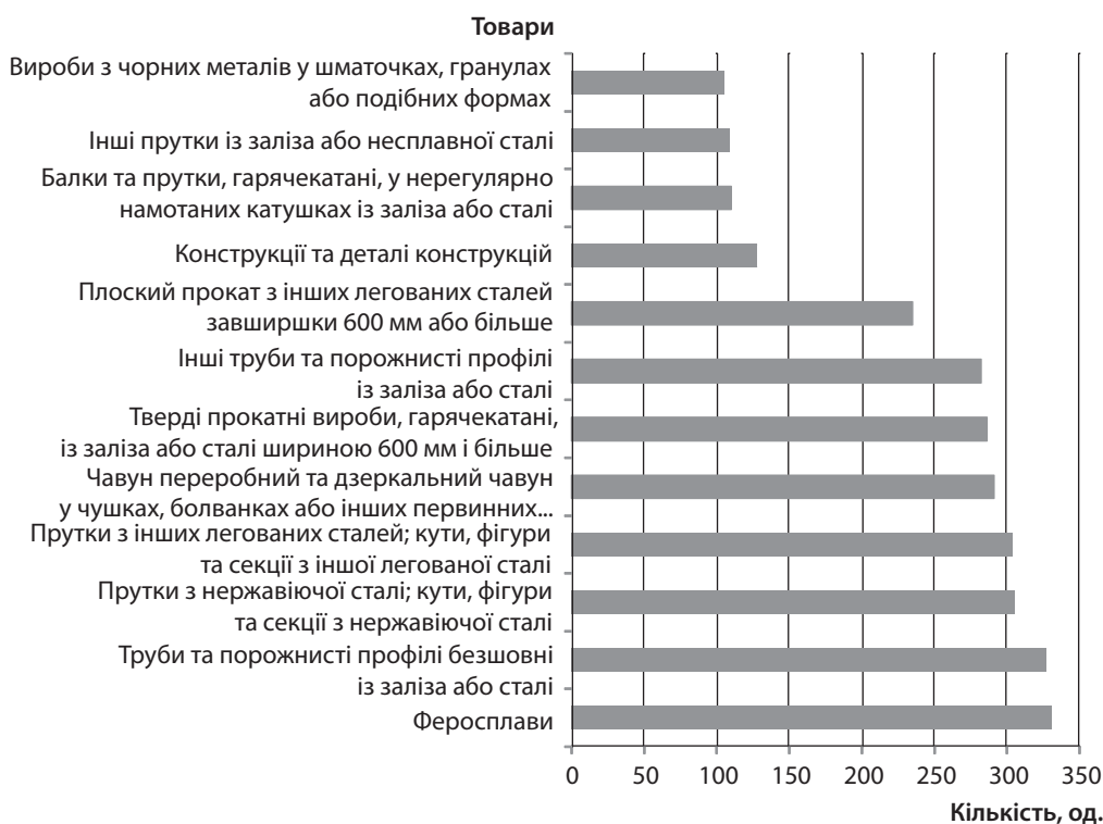
Рис. 4. Українські товари, до яких застосовується найбільше інтервенцій країнами світу