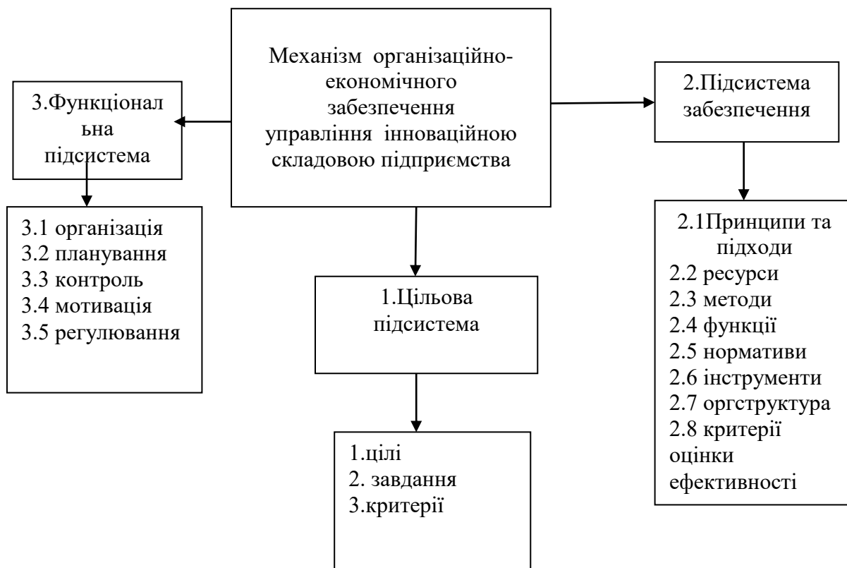
Рис.2. Склад підсистем механізму організаційно-економічного забезпечення управління інноваційною складовою підприємства

комплексності, гнучкого реагування, обґрунтованого ризику на всіх етапах життєвого циклу інновацій, структурності, орієнтації переважно на інновації.