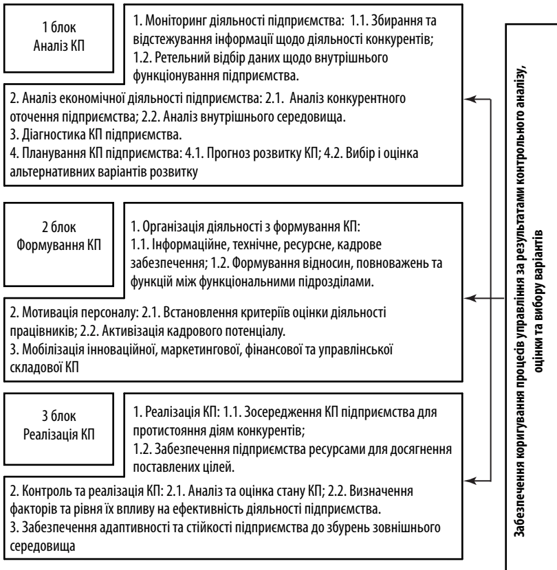
Рис. 2. Концептуальна схема процесу управління конкурентним потенціалом підприємства