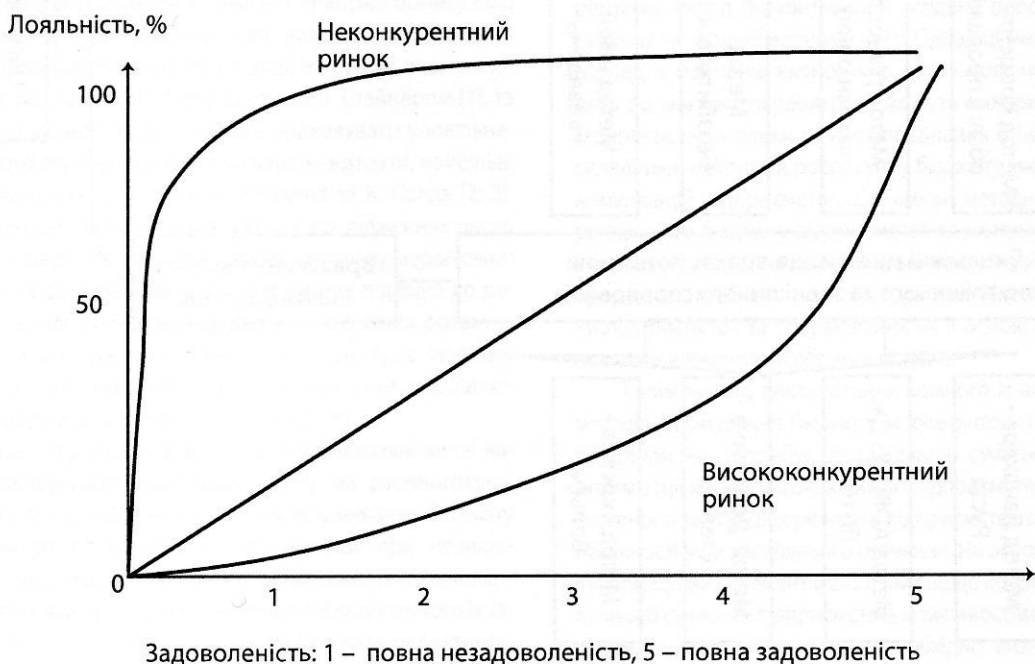
Рис. 2. Взаємозв'язок задоволеності споживачів із лояльністю у довгостроковій перспективі

Однак зміна лояльності клієнтів у довгостроковій перспективі проходить не прямо пропорційно задоволеності клієнтів, що виражається у покупках, а отже частці підприємства на ринку. Згідно з дослідженнями Т. Джонсона та У. Сапера, існує більш складна закономірність, яку слід враховувати при визначенні витрат на маркетингові комунікації (рис. 2). В умовах слабоконкурентних ринків – верхня частина рисунку зліва – задоволеність слабо впливає на лояльність. Така закономірність спостерігається на ринках монополій, що регулюються (видобувна промисловість,