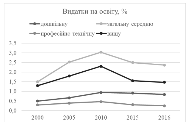
Рис. 2. Видатки на освіту, у % до ВВП