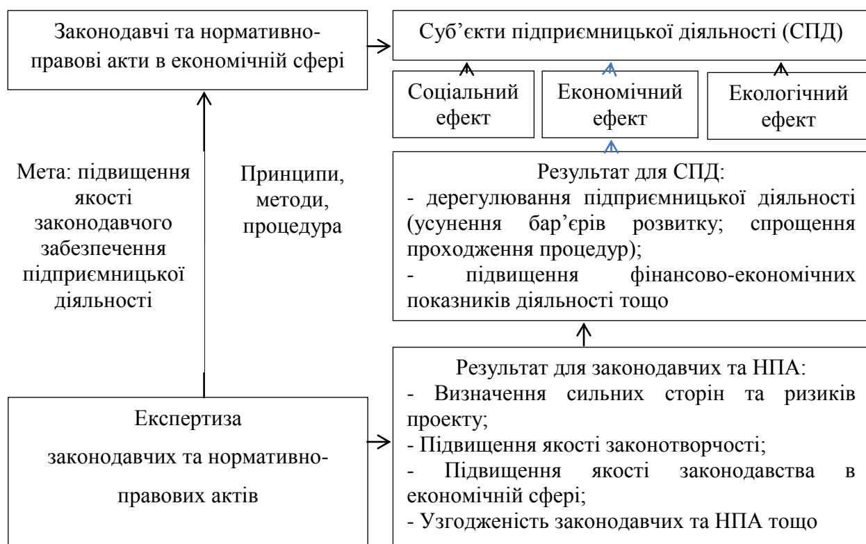
Рис. 1. Роль експертизи в процесі прийняття законодавчих актів в економічній сфері

Аналізуючи наукові підходи до сутності та ролі експертизи, можна запропонувати наступну схему впливу експертизи в процесі прийняття законодавчих та нормативно-правових актів в економічній сфері (рис.1).