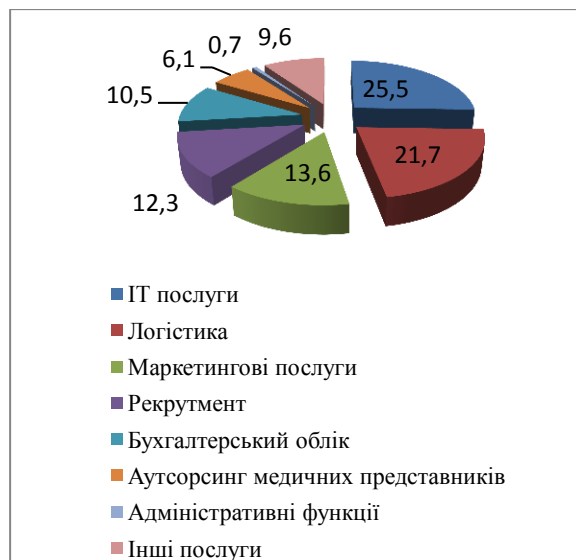
Рис. 1. Розподіл послуг аутсорсингу в Україні

У сфері логістики межі аутсорсингу можуть бути обмеженими тільки закупівлею деяких логістичних функцій, або можуть охоплювати управління цілими ланцюгами постачання.