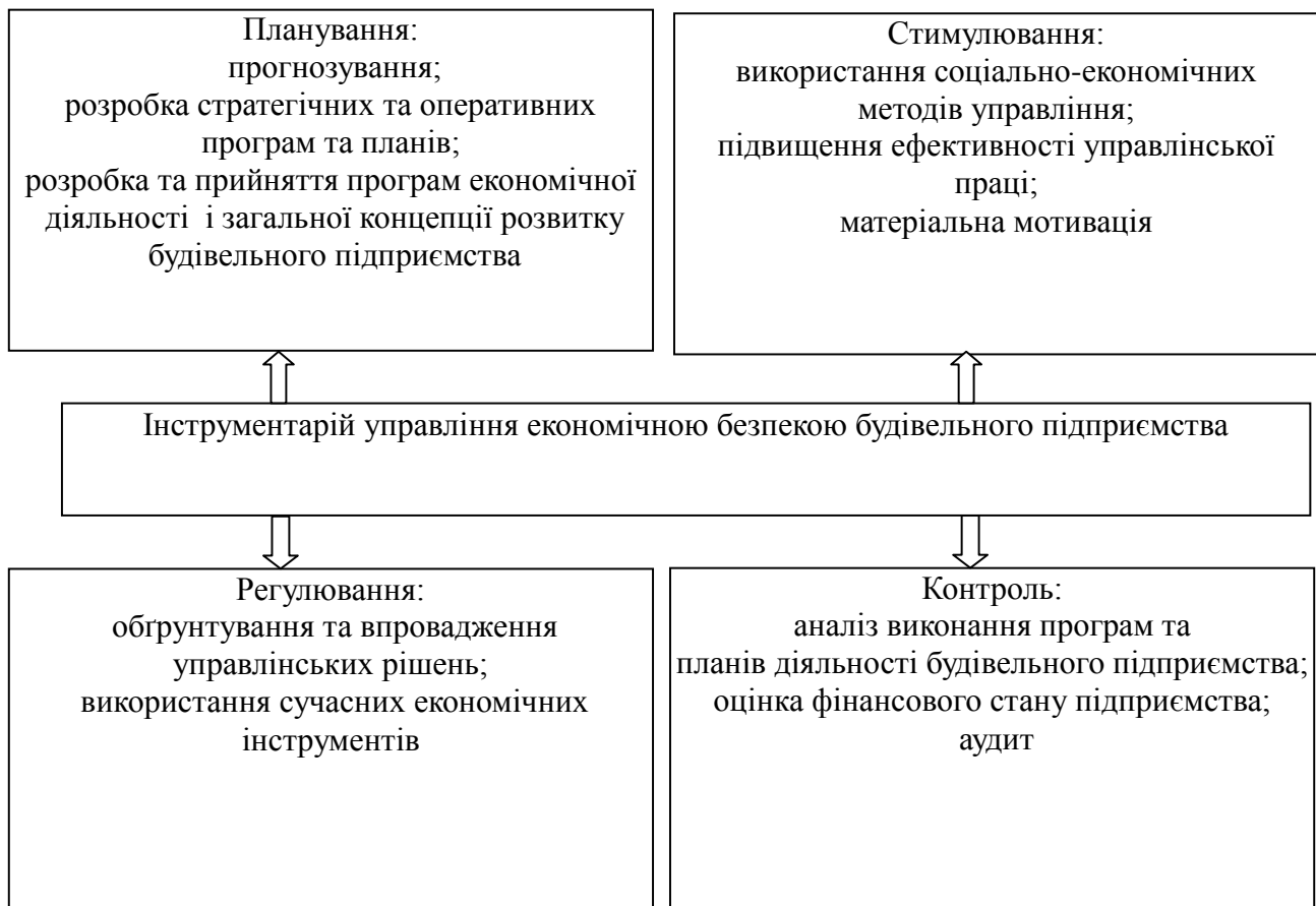
Рис. 4. Інструментарій управління економічною безпекою будівельного підприємства

регулювання, контроль, стимулювання (рис. 4).