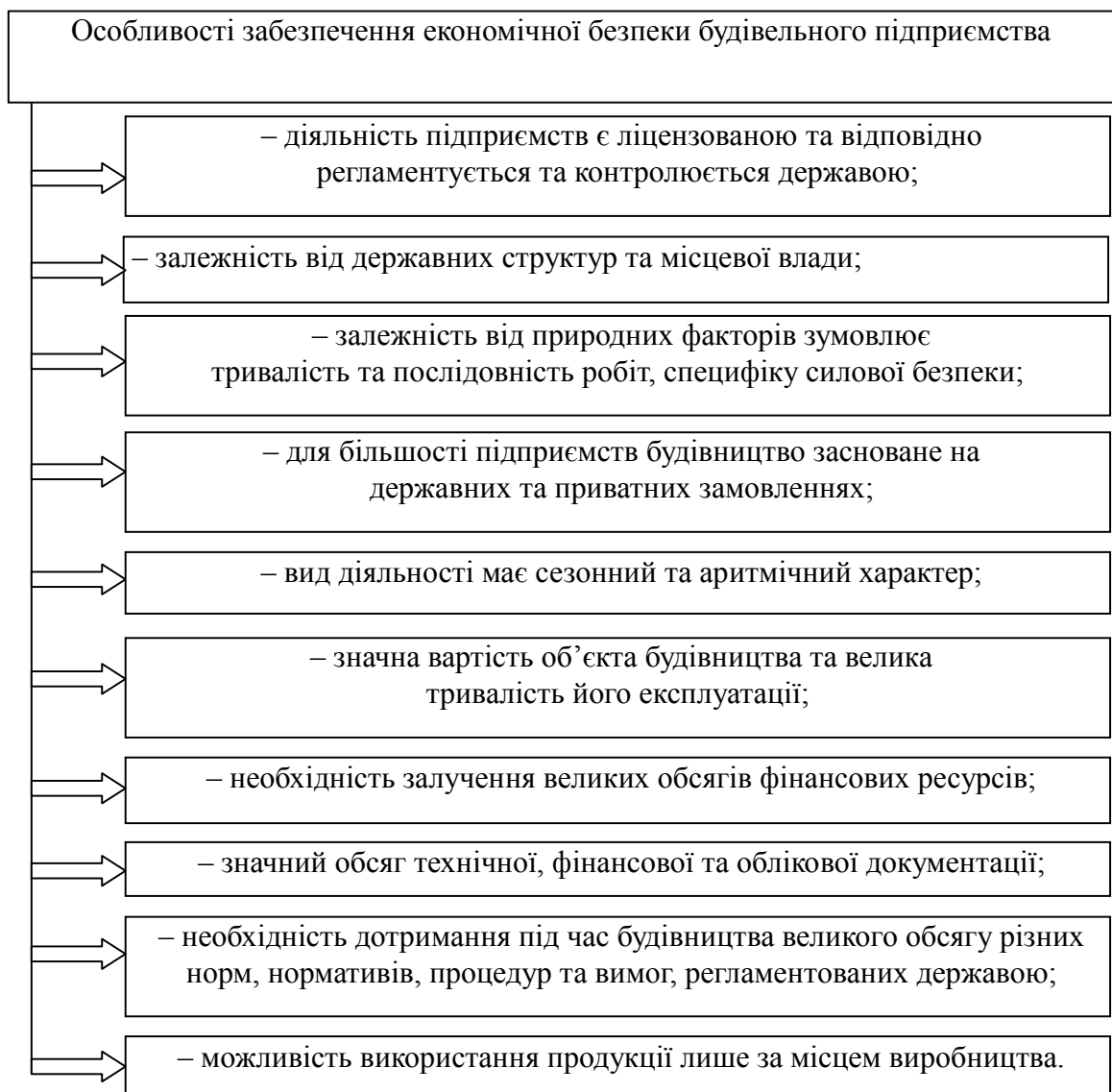
Рис. 1. Особливості економічної безпеки будівельного підприємства

Перейдемо до аналізу та оцінку особливостей діяльності будівельних підприємств та, відповідно, їх економічної безпеки (рис.1).