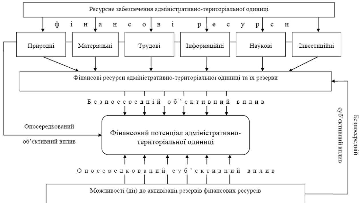
Рис. 2. Складові визначення фінансового потенціалу адміністративно-територіальної одиниці

Кількість і якість природних, матеріальних, трудових, інформаційних, наукових та інвестиційних ресурсів адміністративно-територіальної одиниці забезпечує наявну сукупність і приріст фінансових ресурсів та їх резервів, і так опосередковано впливає на її фінансовий потенціал. Додатково, з посиленням на вищевикладене, такий вплив визначаємо, як вплив об'єктивних факторів. Першочергово самі фінансові ресурси вже безпосередньо впливають на стан і рівень фінансового потенціалу адміністративно-територіальної одиниці.