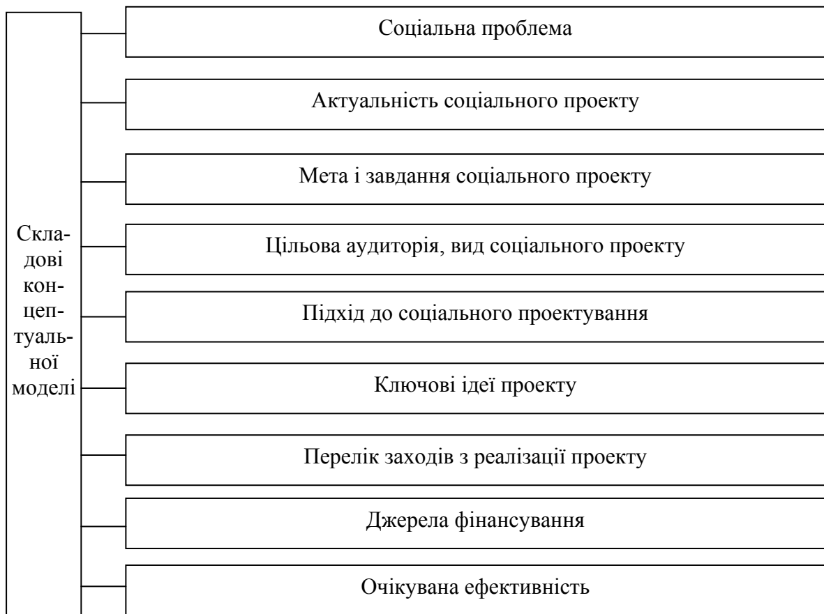
Рис. 2. Концептуальна модель соціального проекту

Успішність соціального проектування залежить від ступеня наукової обґрунтованості технології його здійснення. У більшості випадків виділяють три етапи соціального проектування: підготовчий, основний і заключний. Такий підхід не враховує особливості і зміст соціального проектування. Тому доцільним є розширення переліку етапів соціального проектування.