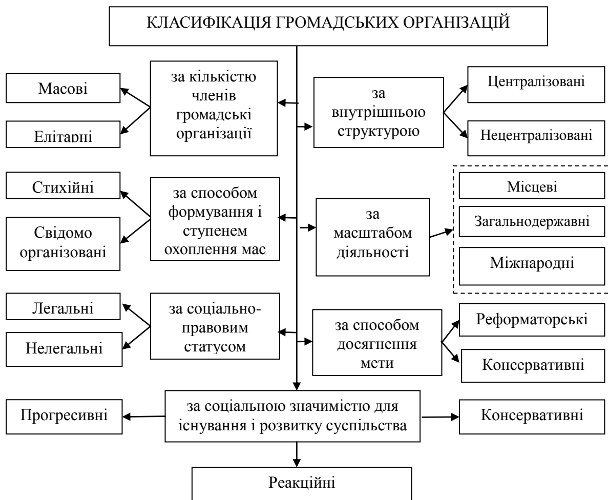
Рис. 1. Класифікація громадських організацій

Аналіз класифікаційних ознак довів існування різноманітної класифікації. З метою впорядкування, відображення існуючої мережі громадських організацій на рисунку 1 представлена загальна класифікація громадських організацій.