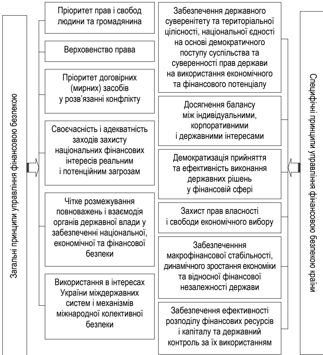
Рис. 4. Принципи управління фінансовою безпекою

Управління фінансовою безпекою держави потребує розв'язання широкого кола проблем, які стосуються визначення критеріїв фінансової безпеки; постійного відстеження чинників, які викликають загрозу фінансовій безпеці країни; розроблення заходів щодо їх попередження та подолання.