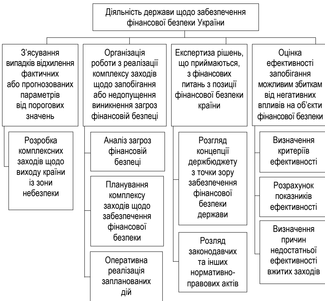
Рис. 3. Напрями діяльності держави щодо забезпечення фінансової безпеки держави

Міністерством економіки України для інтегральної оцінки рівня економічної безпеки України в цілому в економіці та за окремими сферами діяльності.