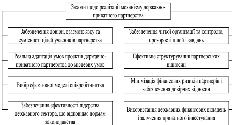
Рис. 1. Заходи щодо забезпечення функціонування механізму державно-приватного партнерства у забезпеченні інвайронментальної безпеки (авторська розробка)

Розвиток і реальне утвердження державно-приватного партнерства у сфері забезпечення інвайронментальної безпеки підприємств залежить від реалізації комплексу стратегічних і тактичних заходів, здатних створити необхідні умови для активізації потенціалу партнерства, які були б спрямовані на забезпечення економічної безпеки країни та її конкурентоспроможності на глобальному ринку. До основних із них можна віднести наступні (рис. 1).