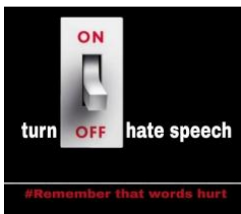
Рис. 5. Приклад постеру «Turn off hate speech» (авторка К. Манченко, студентка 3 курсу).

У ході наступного етапу нашого дослідження з групою студентів третього курсу (25 осіб), які приймали участь у здійсненні вищезазначеного моніторингу, було розроблені постери для спонукання певних категорій населення до замислення над моделями власної взаємодії із соціумом та мотивування їх до припинення використання мови ворожнечі.