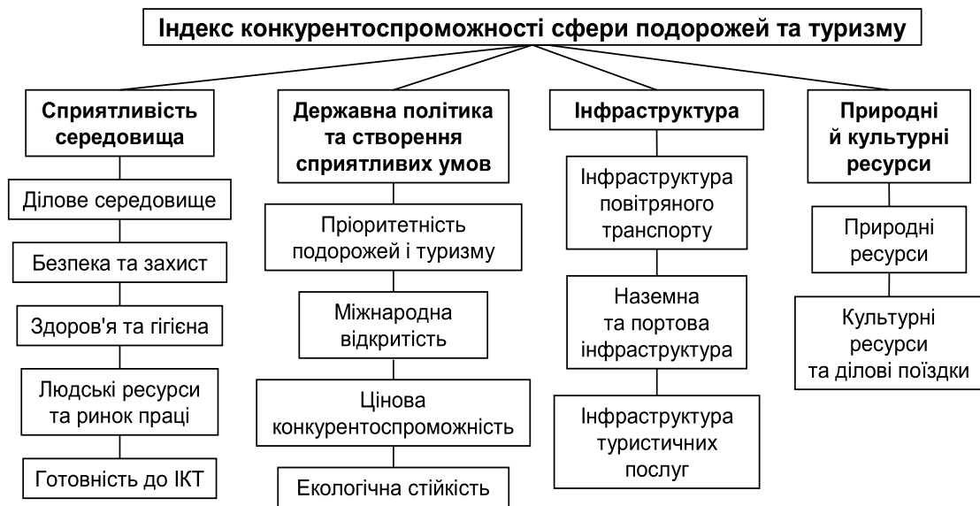
Рис. 2. Структура індексу конкурентоспроможності сфери подорожей та туризму.