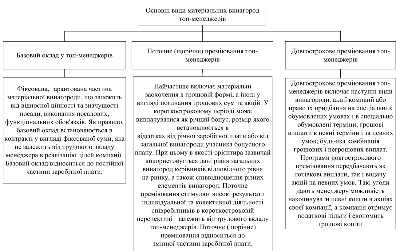
Рис. 1. Основні види матеріальних винагород топ-менеджерів

Проведене дослідження видів стимулювання свідчить, що питання висвітлення основних елементів системи стимулювання менеджерів стратегічного рівня управління потребує подальшого дослідження, щодо удосконалення та актуалізації винагород.