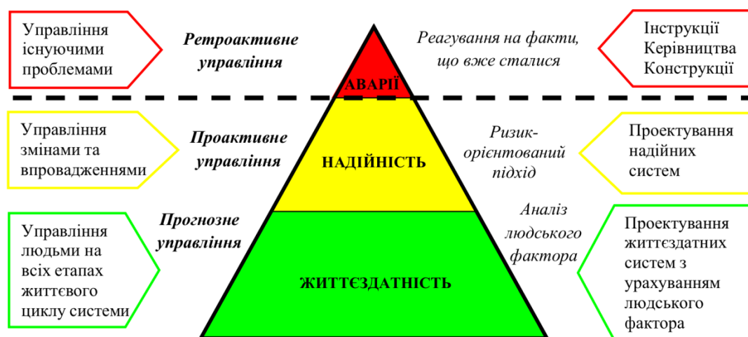
Рис. 1 – Модель «Айсберг» керування змінами у сфері безпеки складних систем

Відомо, що в галузі авіації посібники з людського чинника та інструкції з безпеки розробляли і вдосконалювали протягом десятиліть на підставі аналізу авіаційних інцидентів. Тобто «ціна» цих знань є надзвичайно високою. По відношенню до БПЛА, такий підхід заздалегідь приречений на провал, оскільки кількість БПЛА, що перебувають у експлуатації, не можна порівняти з пілотованими апаратами. Отже, над нами постійно знаходиться значна кількість потенційно небезпечних об'єктів, керованих людьми. І тут виявляються всі типові проблеми людського фактору: випадкові і навмисні помилки, недостатній рівень знань, відсутність певних навичок; помилки організаційного характеру, наслідки стресу або хвороби людини тощо. Очевидно, що необхідно прогнозне управління ризиками, а не аналіз подій для напрацювання досвіду експлуатації (рис.1).