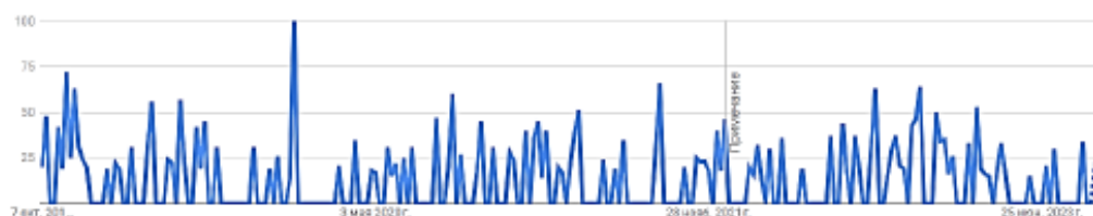
Рис. 1 Діаграма частоти запитів поняття «оцінка ризику діяльності» впродовж 2019-2023 рр.

Для отримання об'єктивної оцінки щодо актуальності поняття обрано період дослідження з 2019-2023 рр. Більш того, оброблено запити двома мовами: українською – оцінка ризику діяльності та англійською – activity risk assessment. Отримані результати за двома запитамі мають повністю ідентичний вигляд, що свідчить про однаковий рівень зацікавленості поняттям «оцінка ризику діяльності» в Україні в незалежності від обраної мови дослідження (див. рис. 1.).