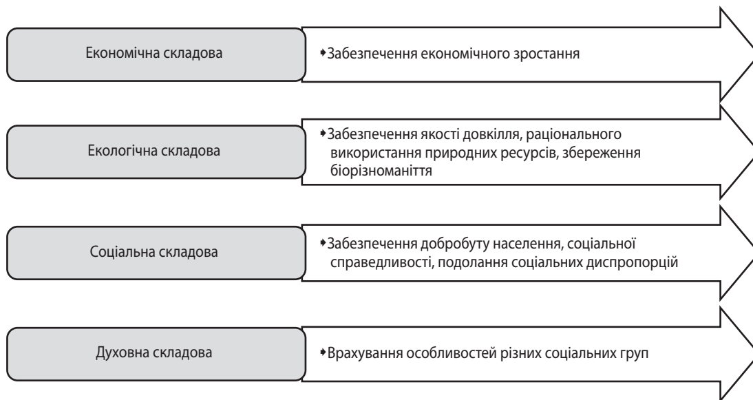
Рис. 1. Складові елементи сталого розвитку [1]

передумови для створення суспільства із новим глобальним баченням шляхів вирішення проблем людства: економічних, екологічних і соціальних. Отже, авторами пропонується подати структуру елементів сталого розвитку, враховуючи можливості їх взаємодії, у такому вигляді (рис. 2).