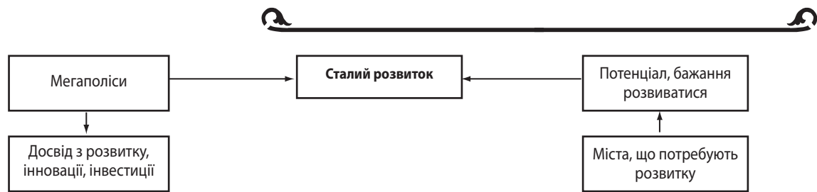
Рис. 4. Взаємодія мегаполісів і міст, що розвиваються у рамках Концепції сталого розвитку

тивами подальших досліджень є обґрунтування соціоекономічної ефективності сталого розвитку мегаполісів в умовах сучасних глобальних викликів.