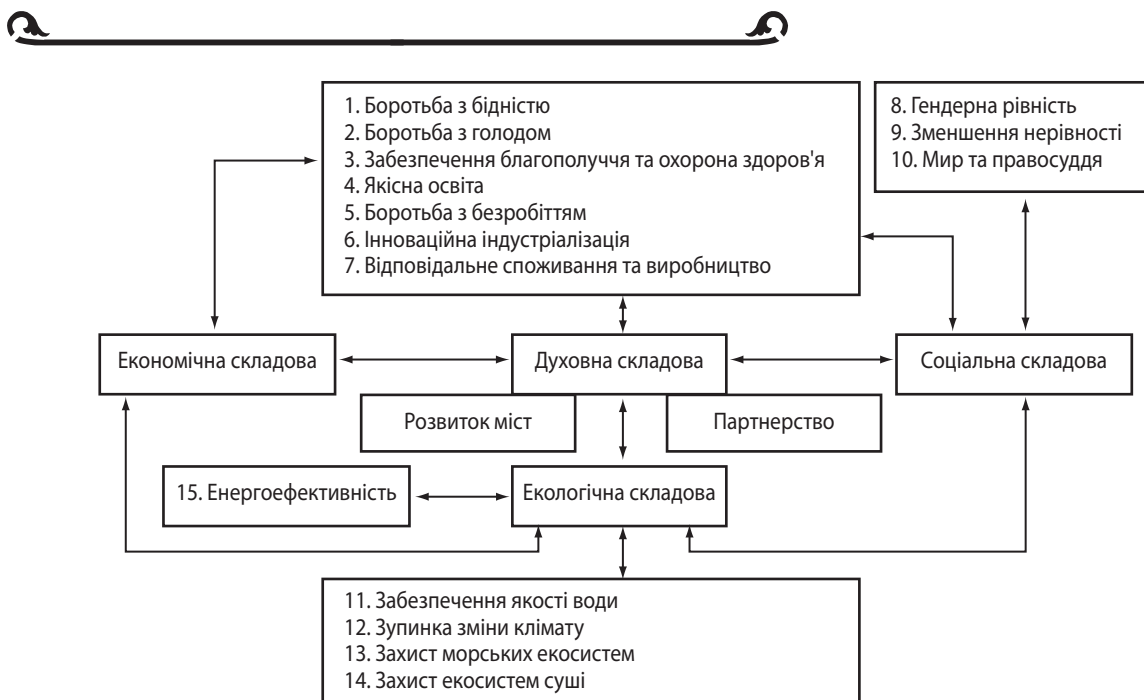
Рис. 3. Глобальні цілі сталого розвитку за концепцією ООН [1]

– міграція працездатного населення, що пов'язана із великою кількістю біженців, та, як результат, расова дискримінація та створення умов для наростання нетерпимості людей до представників інших національностей;