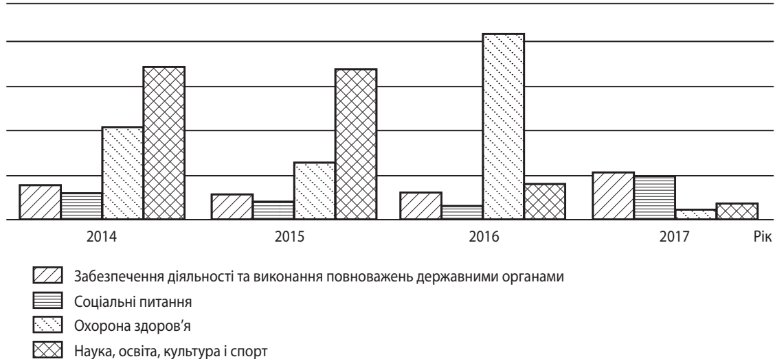
Рис. 2. Обсяги неефективного управління та використання державних коштів, виявлених у 2014–2017 рр., за напрямками