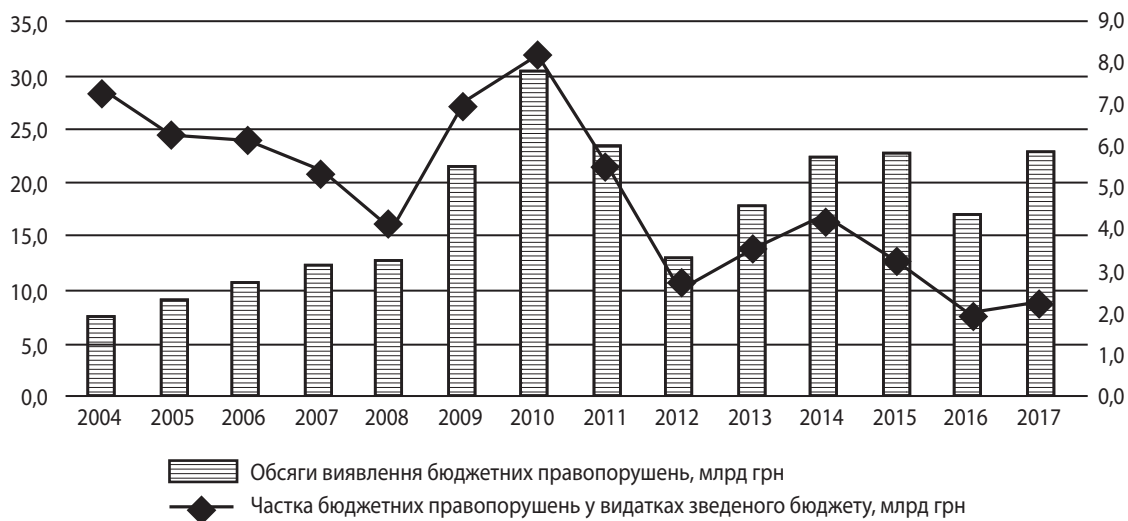
Рис. 3. Обсяг і частка виявлених Рахунковою палатою порушень бюджетного законодавства за 2004–2017 рр.