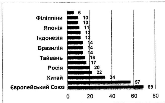
Рис. 2. Кількість застосованих країнами торговельних бар'єрів у міжнародній торгівлі за 2011 – 2013 рр., од. (за даними джерел [10; 11])

Серед країн, що використовують найбільшу кількість інституційних бар'єрів та активно сприяють політиці прихованого протекціонізму, є найбільш розвинені країни світу, що мають значні розміри внутрішнього ринку, серед них ринки: ЄС, США, Китаю, Індії, Росії та ін. Провідні позиції у використанні інструментів прихованого протекціонізму у вигляді інституційних бар'єрів для перешкоджання вільному доступу товарів та послуг на власні ринки належать ЄС. За останні роки ЄС ініціював 69 торговельних бар'єрів, а США – 57 бар'єрів. Створення торговельних бар'єрів найбільш розвинутих економік світу значно впливає на світову торгівлю, уповільнюючи її зростання, та скорочує експорт товарів і послуг. За формального домінування та підтримання принципів "вільної торгівлі" розвинутими країнами відбувається підміна понять.