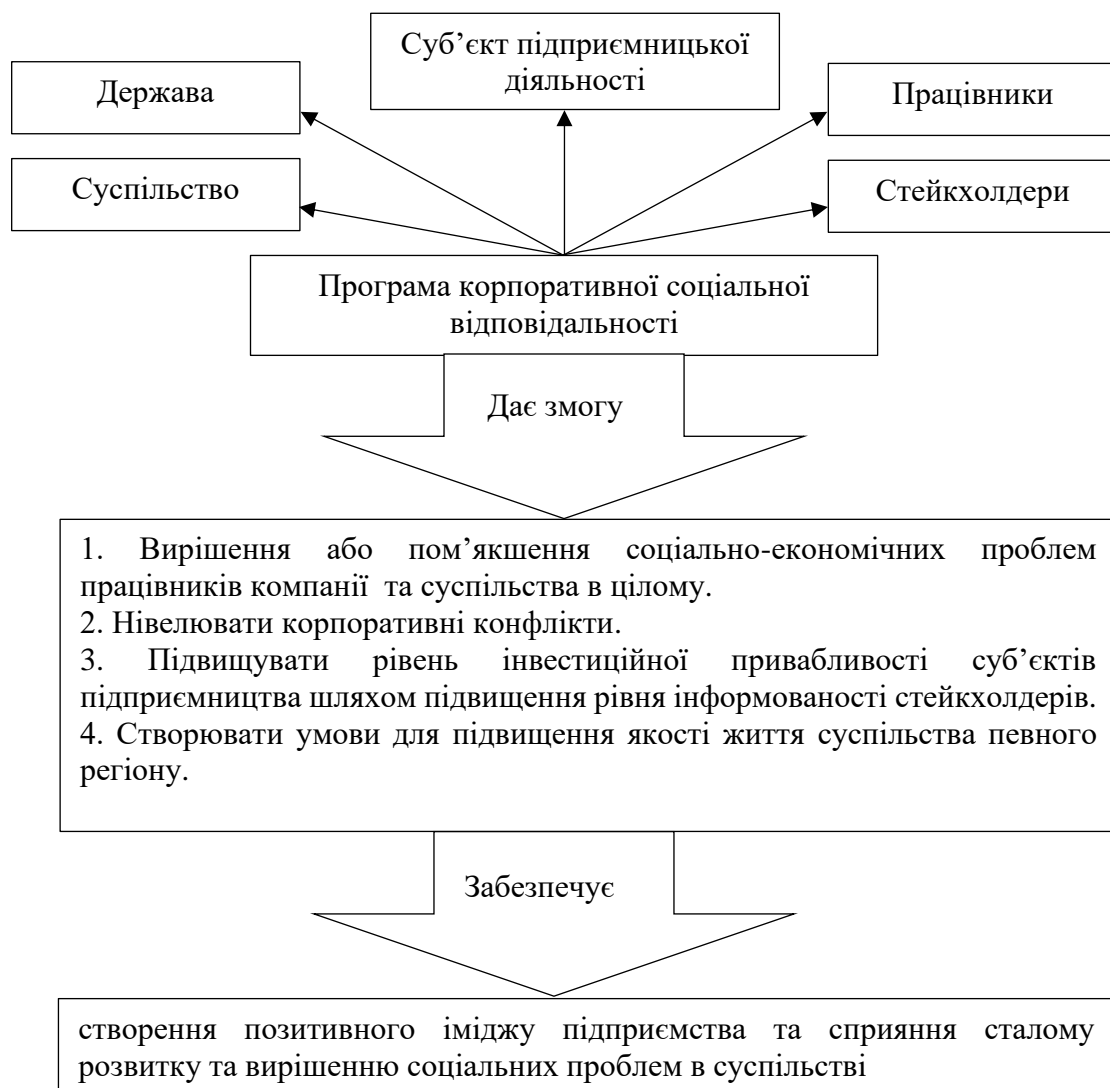
Рис. 2. Програма корпоративної соціальної відповідальності

У зв'язку із цим виникає необхідність використання стратегічних підходів до формування корпоративної соціальної відповідальності на рівні українських суб'єктів господарювання. На рис. 2 наведено модель програми корпоративної соціальної відповідальності.