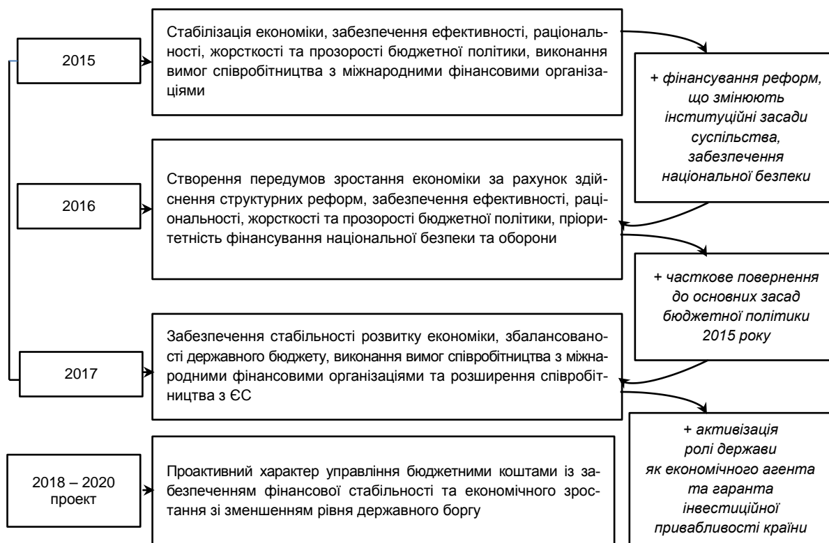
Рис. 2. Розвиток основної ідеї бюджетної політики України у 2015 – 2020 рр.

У найбільш концентрованому вигляді концептуальні засади бюджетної політики України наведено в тексті постанов Верховної Ради України щодо основних напрямів бюджетної політики України за відповідні роки [4 – 7]. Для ретроспективного аналізу формування концептуальних засад бюджетної політики України було обрано відповідні законодавчі акти за 2014 – 2017 рр., оскільки саме у 2013 – 2014 рр. змінилася національна доктрина. Виходячи з того, що національна доктрина є сталою протягом 2014 – 2017 рр., то очевидно, що основна ідея бюджетної політики, її генеральна спрямованість мають залишатися незмінними, або піддаватися незначній трансформації в разі суттєвих змін стану національної економіки. Такі зміни виникають, зазвичай, під час переходу від однієї стадії економічного циклу до іншого. Однак аналіз тексту бюджетних резолюцій свідчить про певну неусталеність самої спрямованості бюджетної політики (рис. 2).