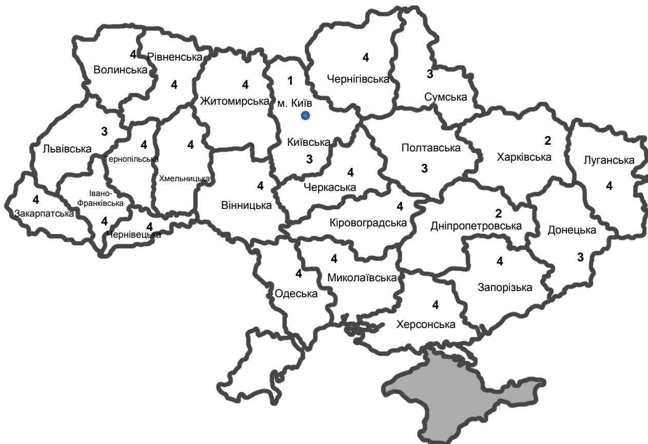
Рис. 4. Просторовий розподіл кластерів у 2015 році (розроблено автором) [Spatial distribution of clusters in 2015 (developed by the author)]

Аналогічні розрахунки було зроблено також і за 2010 – 2014 роки (на основі даних [16 – 20]), що дозволило дослідити динаміку кластеризації підприємств України за РІР у регіональному аспекті, результати групування наведено в табл. 4.