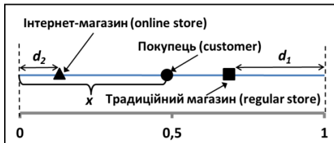
Рис. 1. Місцезнаходження покупця, Інтернет-магазину та традиційного магазину в моделі "лінійного міста" [The customer, online store and regular store location in the "linear city" model]

Для аналізу ситуації спочатку слід розглянути модель, коли існують рівноважні ціни та прибутки звичайного магазину та Інтернет-магазину. Потім умови, за яких звичайний продавець створює Інтернет-магазин і починає конкуренцію з іншими Інтернет-магазинами через два канали продажу товарів (роздрібну й електронну торгівлю). У процесі побудови моделі взаємодії учасників торговельного ринку за наявності електронних і традиційних каналів продажу товарів слід виходити з однорідності вподобань споживачів, до того ж купуючи однакові товари, покупці зазнають різних транзакційних витрат, які визначають за відстанню між розташуванням магазину й покупця. Цю модель досить часто застосовують у ході економічного аналізу, вона становить умовну карту споживчих уподобань [13; 14]. У класичній моделі споживчих уподобань "лінійного міста", яка була запропонована Салопом [15], вважають, що продавці товарів і послуг не є ідентичними для покупців, оскільки перебувають від них на різних відстанях. Щодо електронної торгівлі, автори говорять про певну умовну віддаленість покупців у просторі характеристик товарів і послуг, що корелює з вартістю доставки товару. Тому автори вважають, що, залежно від своїх споживчих пріоритетів, покупці віддають перевагу тому або іншому Інтернет-продавцю, тобто умовна відстань до найбільш привабливого Інтернет-продавця менша, ніж до інших. На рис. 1 наведено місцезнаходження покупця у просторі лінійного торговельного ринку.