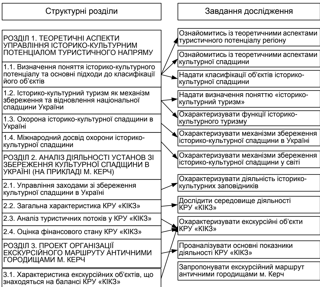
Рис. 3.1. Структурно-логічна схема досліджень

Предмет дослідження: діяльність історико-культурних заповідників як інструменту туристичної інфраструктури регіону