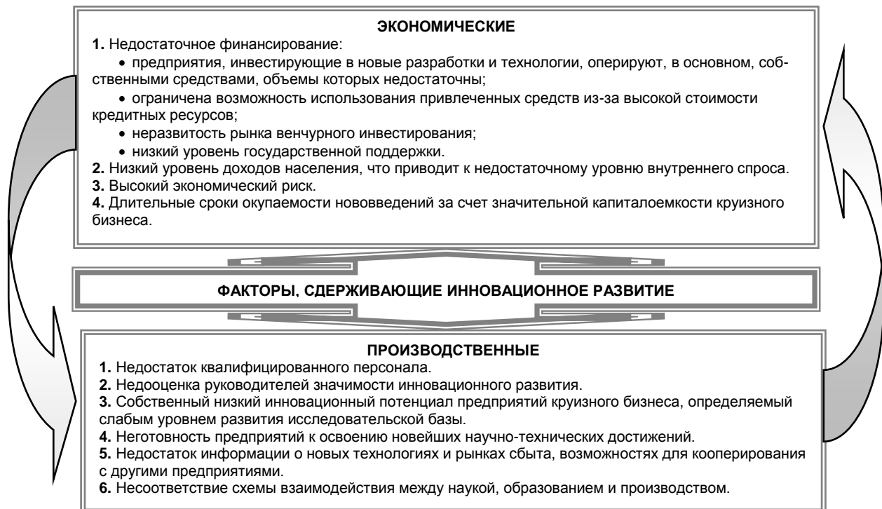
Рис. 1. Основные факторы, препятствующие инновационному развитию предприятий круизного бизнеса

Факторы, сдерживающие осуществление инноваций в круизной индустрии, можно условно разделить на две основные группы – экономические и производственные (рис. 1).