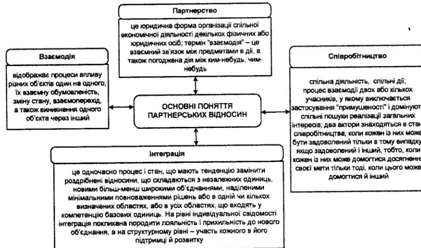
Рис. 1. Основні поняття, що розкривають зміст партнерських відносин

Узагальнення визначень сукупності понять, що аналізуються в рамках поставленої мети, наведені на рис. 1.