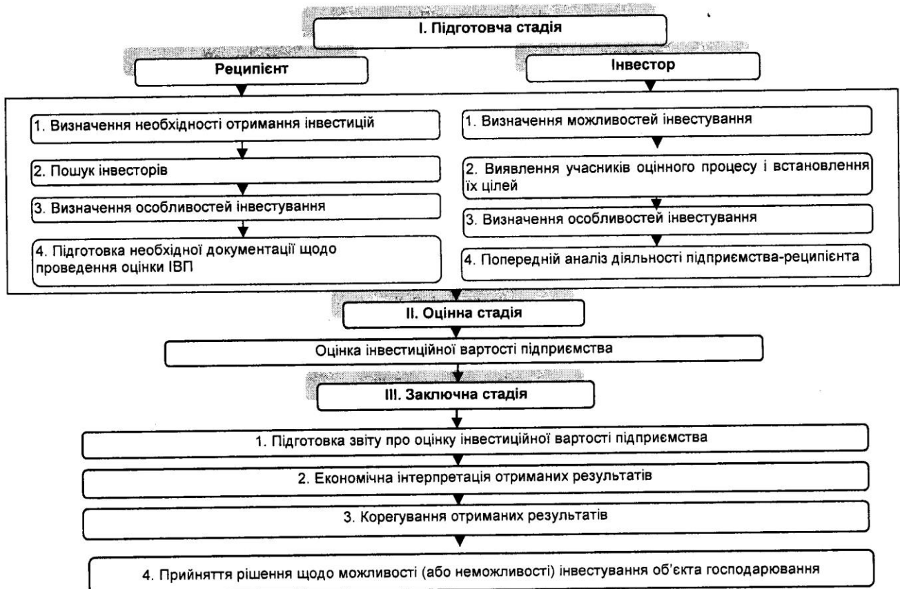
Рис. 1. Концептуальна схема оцінки інвестиційної вартості підприємства

Для досягнення мети, а саме, з одного боку, прийняття управлінського рішення щодо інвестування об'єкта господарювання, а з іншого – прийняття капіталовкладення на визначених умовах, необхідно побудувати концептуальну схему оцінки ІВП, яка наведена на рис. 1.