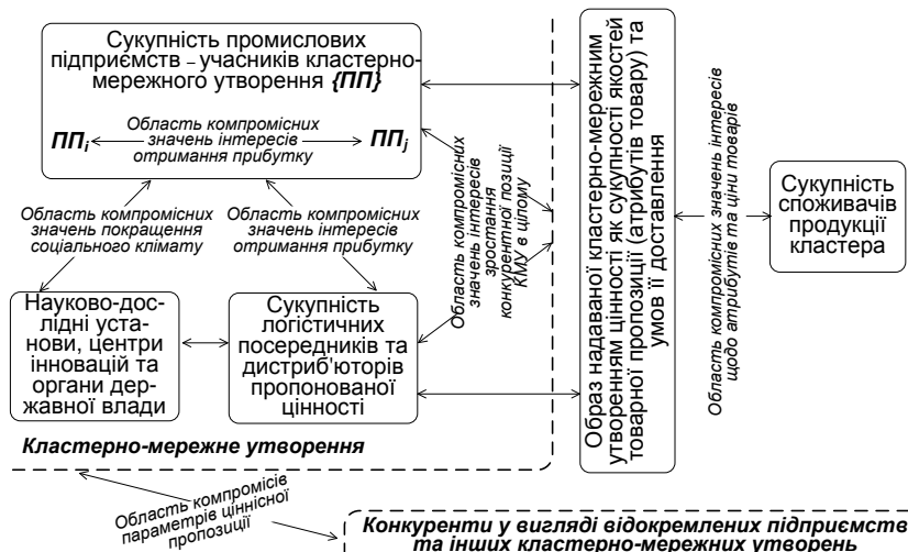
Рис. 1. Підхід до подання кластерно-мережних утворень як середовища гармонізації інтересів їх учасників та стейкхолдерів

Дійсно, будь-яка економічна система може розглядатися в термінах категорії "інтерес". На жаль, наявні розробки [11; 12] оперують цієї категорією на рівні дуальної взаємодії виробника та споживача. Для досягнення мети дослідження автор пропонує розглядати КМУ в цілому як середовище гармонізації інтересів його учасників. Авторський варіант такого розуміння кластера наведено на рис. 1. Особливістю пропозицій є виділення зон гармонізації інтересів на підґрунті залучення набутків дисципліни рефлексивного управління. Тут передбачено як узгодження інтересів сторін, так і узгодження усвідомлень щодо параметрів пропонованої цінності та атрибутів товарів у взаємних уявленнях споживача й виробника в рамках виділених на рис. 1 контурів рефлексивного управління.