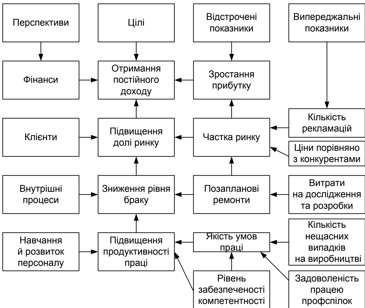
Рис. 3. Причинно-наслідкові зв'язки між показниками та цілями в стратегічній карті

Побудова стратегічної карти з виділенням причинно-наслідкових зв'язків. Слід звернути увагу на те, що стратегічна карта – це надання причинно-наслідкових зв'язків між елементами стратегії підприємства, ці зв'язки ніби розповідають про стратегію. Для отримання збалансованої системи показників, необхідно встановити зв'язки між окремими показниками, причому слід враховувати, що показники поділяються на відстрочені та випереджальні. Стратегічна карта може бути представлена в такому вигляді (рис. 3).